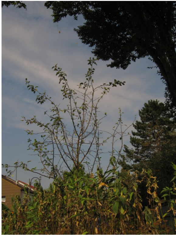
vor Schopenhauerstraße 3a