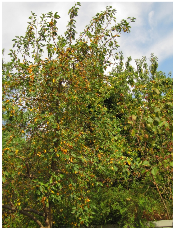
vor Schopenhauerstraße 27