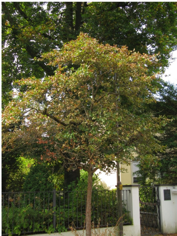
vor Schopenhauerstraße 20