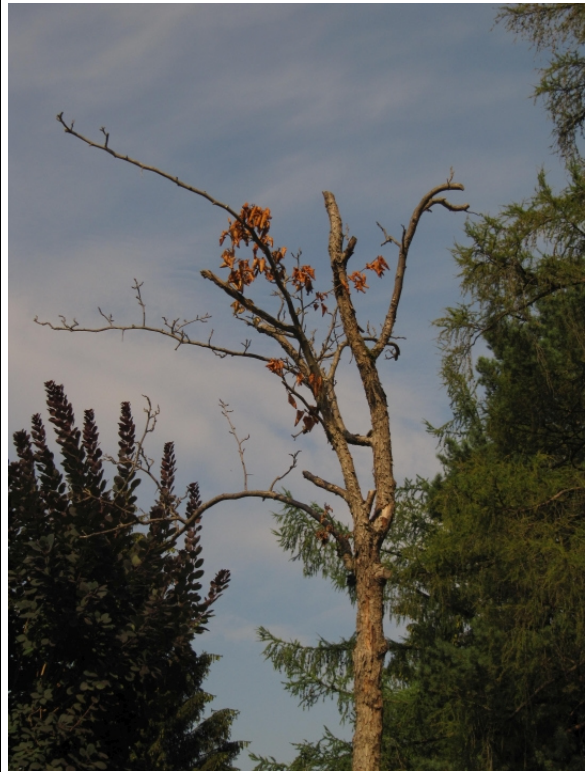
vor Schopenhauerstraße 12